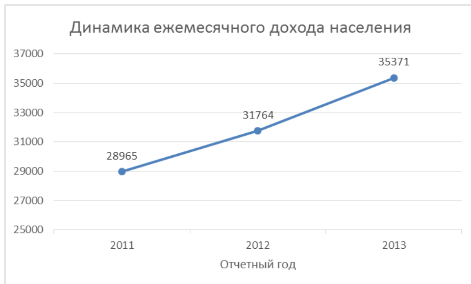
Рисунок 3-1. Изменение ежемесячного дохода населения.

Прогноз изменения доходов населения был составлен на основании данных по региону за 2010-2013 годы, представленных на рисунке 1-1. Согласно текущей динамики, ежегодный рост ежемесячного дохода населения ожидается на уровне 10 %.